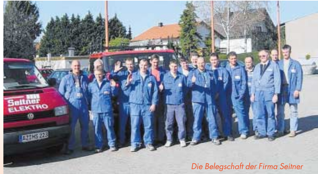
Die Belegschaft der Firma Seitner

ungs- und Elektrobereich. Das Unternehmen Seitner verfügt über eine eigene Gebäudeleitstation, die zurzeit 25 Großanlagen an 365 Tagen, rund um die Uhr fernüberwacht und betreut. Kundenanfragen werden schnellstmöglich abgewickelt, Termine eingehalten und die Arbeiten fachgerecht ausgeführt.